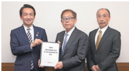
滋谷市長に答申書を手渡す下垣委員長(中央)と小滝副委員長(右)

計画(案)」が、市長に手渡されました。市は、この答申を踏まえ、計画を策定します。 介護保険課管理係 ☎042-497-2079