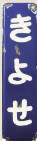
清瀬駅駅標（個人蔵）