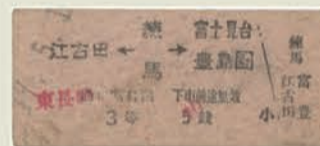
武蔵野鉄道時代の切符（個人蔵）