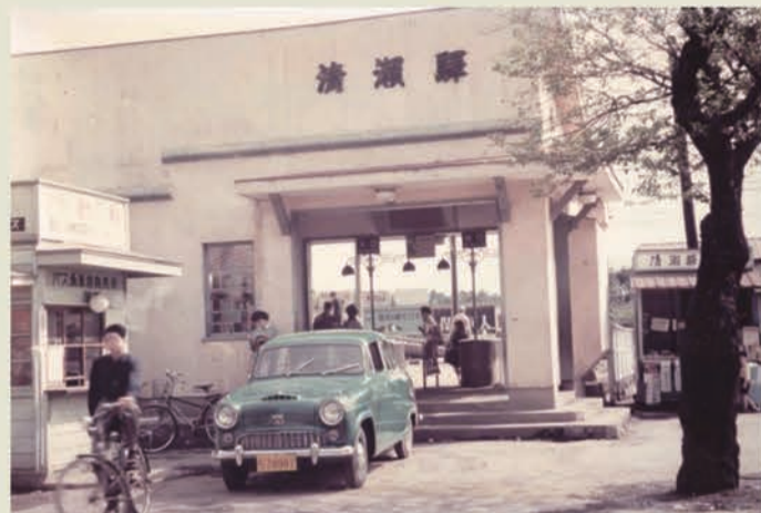
昭和28～38年頃撮影 2代目清瀬駅