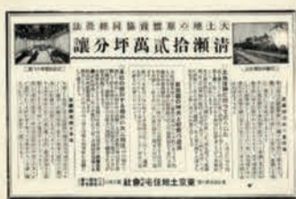
清瀬12万坪分譲募集広告（個人蔵）