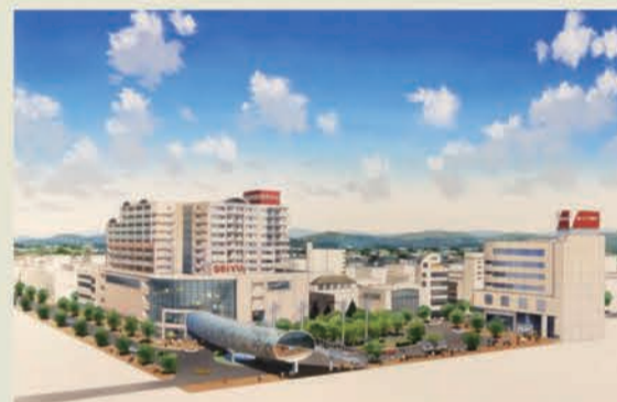
平成7年北口再開発事業完成予想図（当館所蔵）