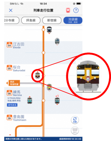
「西武線アプリ」表示イメージ

https://www.seibuapp.jp/railways/seibulineapp/