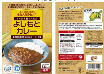
商品パッケージ(デザインイメージ)