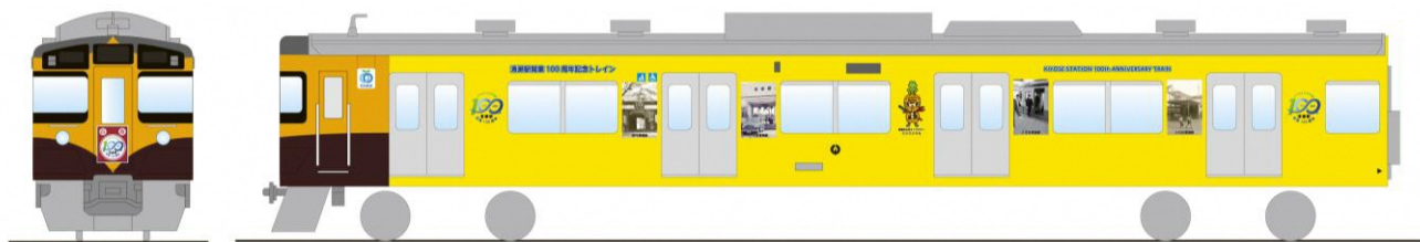
ラッピング車両（デザインイメージ）