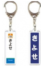
オリジナル駅名標 アクリルキーホルダー