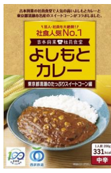
よしもとカレー 「東京都清瀬のたっぴりスイートコーン編」