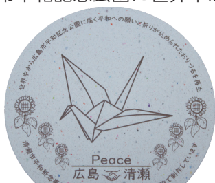
おりづるコースター