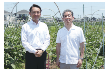
下井氏(右)と澁谷市長