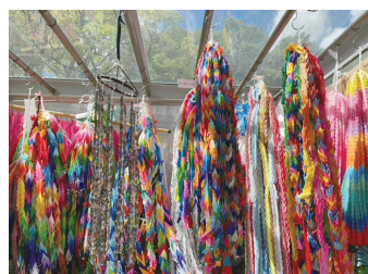
広島市平和記念公園内に 捧げられた折り鶴