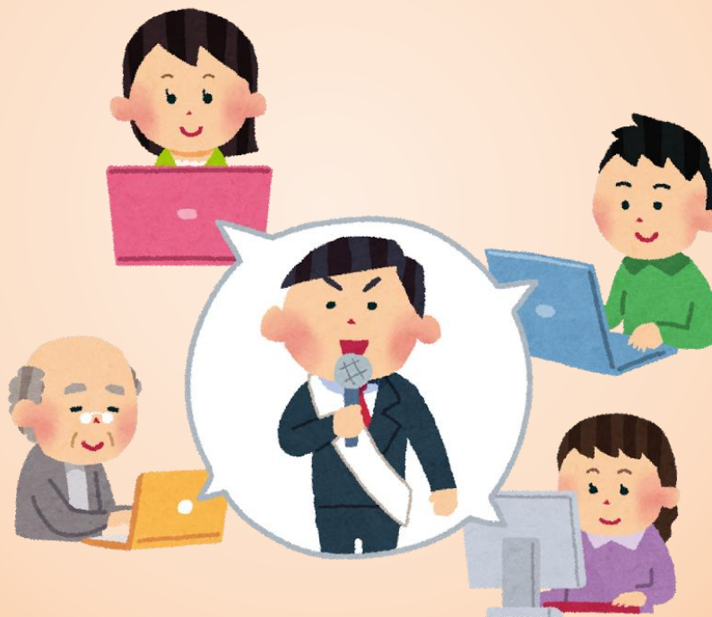
候補者・政党のHP等を見たり