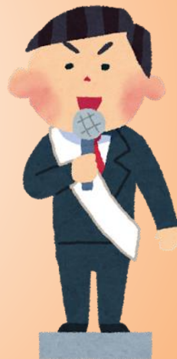
街頭演説を聞いたり