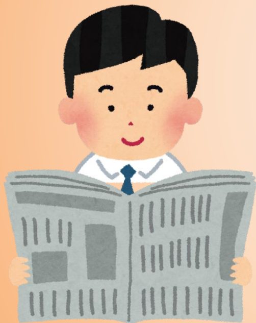
選挙公報を見たり