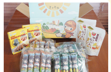
きよセット商品内容

【商品内容(各商品2個ずつ)】きよせ棒(きんぴらごぼう味、コーンポタージュ味)、東京・清瀬 やさいあられ、キョセゴウカレー