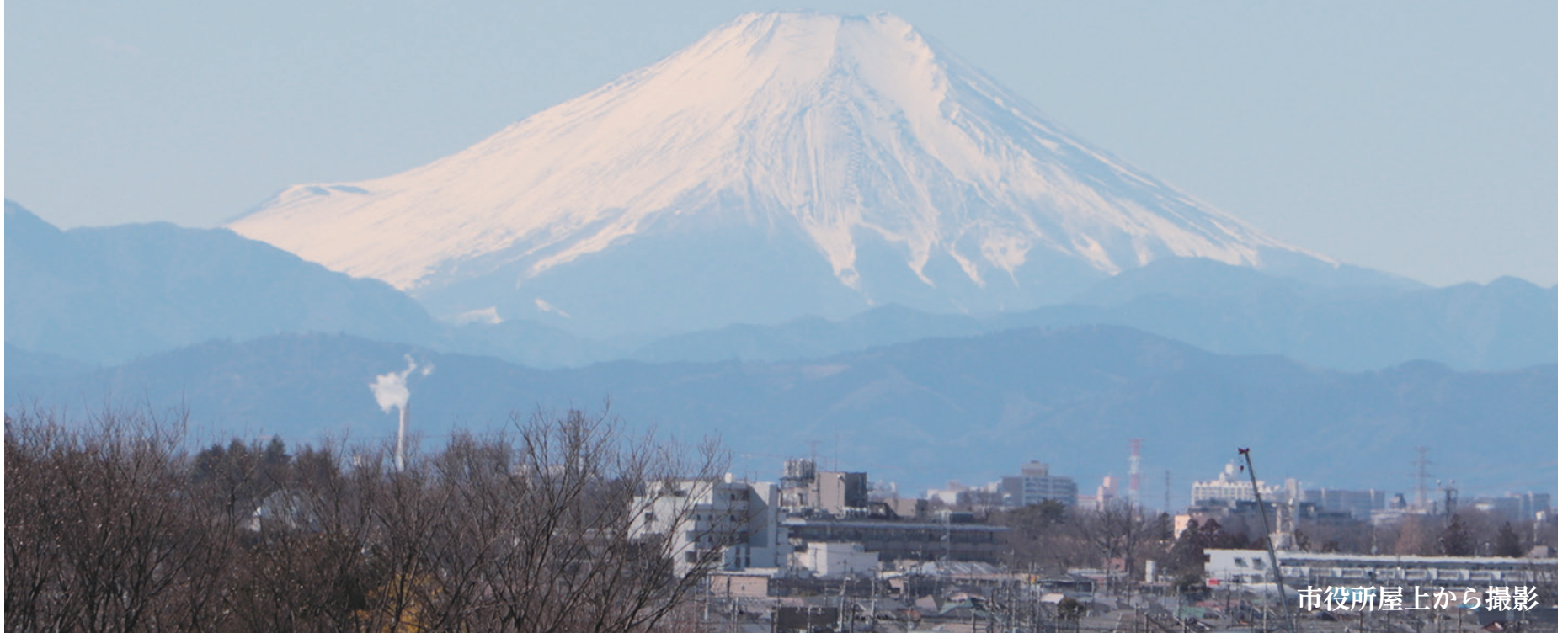
市役所屋上から撮影