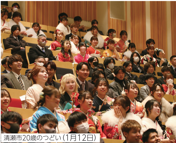
清瀬市20歳のつどい(1月12日)