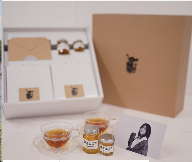
中森明菜さんコラボ ふるさと納税返礼品(8月13日)