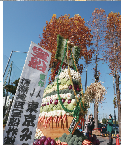
清瀬市農業まつり(11月15日・16日)