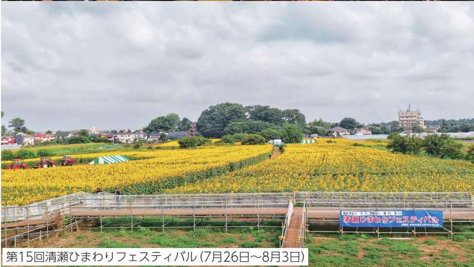
第15回清瀬ひまわりフェスティバル(7月26日～8月3日)