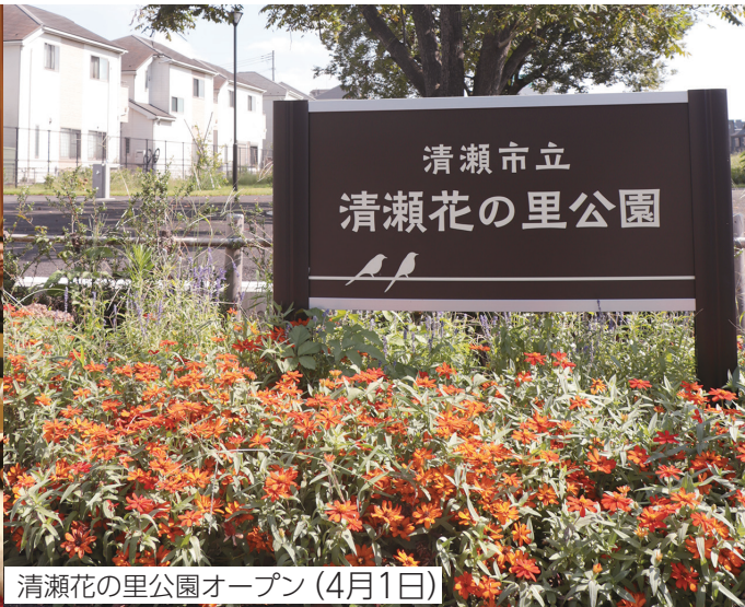
清瀬花の里公園オープン(4月1日)