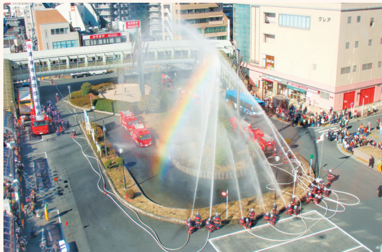
昨年実施した出初式の一斉放水の様子

今年も清瀬駅北口駅前ロータリーで清瀬市消防団出初式を開催します。さらなる防火・防災思想の普及、消防力のPRや向上が目的です。多くのご来賓の皆さまのご臨席のもと、消防団員の表彰、分列行進、一斉放水、消防少年団による演技などを実施します。消防団員の雄姿をぜひご覧ください！ ※駅前の喫煙所は午前9時から午後1時まで閉鎖します。 ※駐車場、駐輪場はございません。 ※荒天時はアミューホールにて縮小開催となり、一般の方はご来場できません(交通規制も行われません)。 ☎防災防犯課防災防犯係 ☎042-497-1847