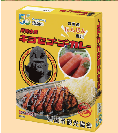
市制施行55周年記念「キョセゴーゴーカレー」販売開始(9月23日)