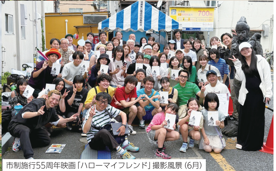
市制施行55周年映画「ハローマイフレンド」撮影風景(6月)