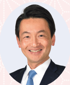
清瀬市長 澁谷 桂司

本年が市民の皆さまにとって喜びと笑顔あふれる年となりますよう心から祈念申し上げます。