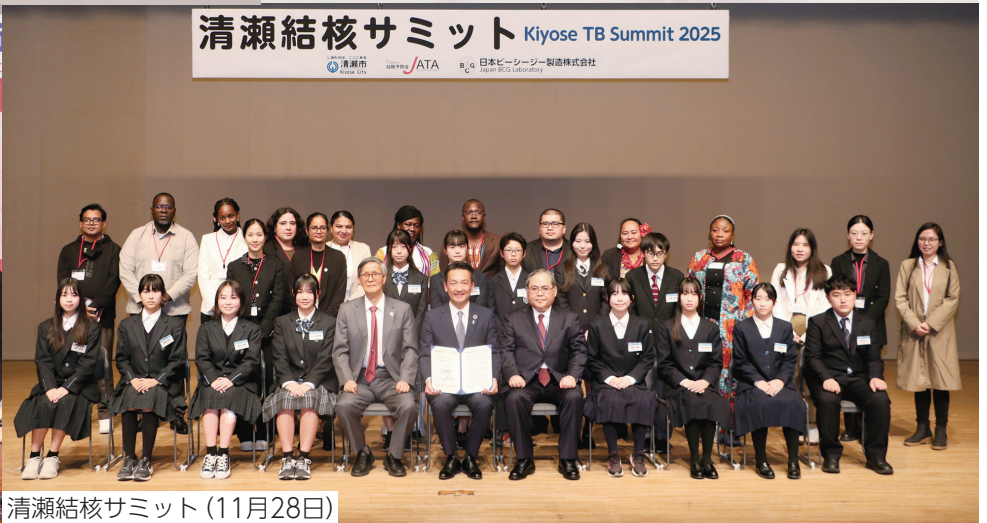
清瀬結核サミット(11月28日)

納税にご協力を ■夜間納税・納税相談 ☎1月28日(水)・29日(木)午後8時まで ■日曜納税・納税相談 ☎1月25日(日)午前9時～午後4時 ■土曜納税・納税相談 ☎1月10日(土)午前9時～正午 場いづれも市役所徴収課窓口 問徴収課徴収係 ☎042-497-2045