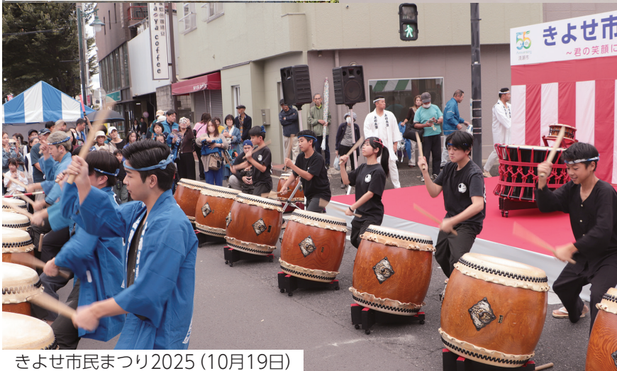
きよせ市民まつり2025(10月19日)