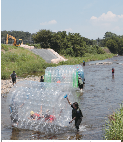
2025 きよせの環境・川まつり(7月26日)