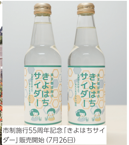
市制施行55周年記念「きよはちサイダー」販売開始(7月26日)