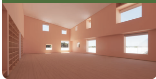
屋内ひろば(遊戯室)