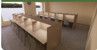
エチュード梅園(学習室)