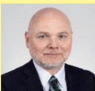
駐日アイスランド大使 フレイン・パウルソン氏