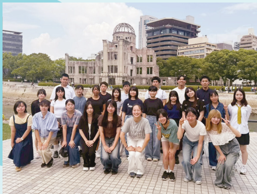
「平和ユース」として参加された皆さま