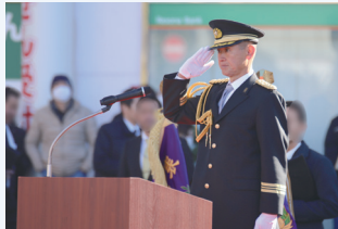
清瀬市消防団長訓示