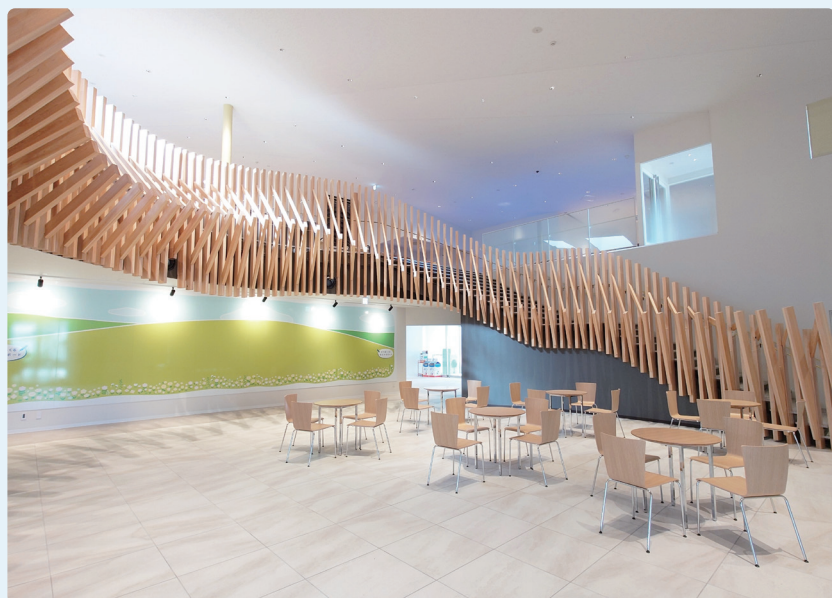
エントランスの吹き抜けから2階図書館(左側)を見上げた様子

建築の魅力と多様な過ごし方が調和した図書館として、日常の中で知識に触れ、心を整える時間を提供します。