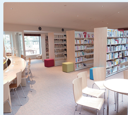
館内の様子。左側はカウンターデスク(コンセントと手元灯あり)