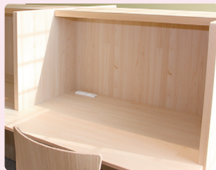
学習室の机(一口コンセント)