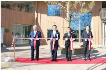
当日(テープカット)の様子