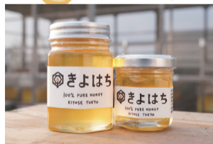
常時販売する「きよはち」