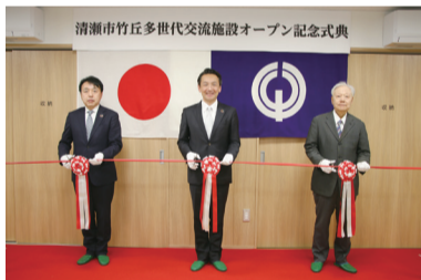
オープン記念式典の様子

竹丘老人いこいの家を建替え、4月1日に竹丘多世代交流施設を開設します。3月19日に実施した式典にはシニアクラブや竹丘地域の方々に参加されました。この施設は子どもから高齢者までの多世代が交流し、地域の賑わいを創出することを目的としており、公共施設予約システムで一般利用者にも貸し出しを行います。