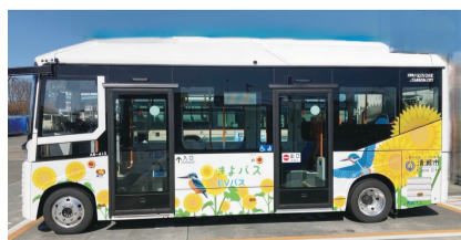
2台目の「きよバス」EVバス