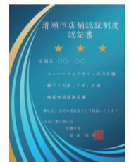
認証書のイメージ