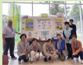
昨年の展示ブースの様子

活動を紹介するパネル展示の他、機関紙「てとてとて」やオリジナル絆創膏を配布します。