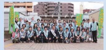
昨年の駅頭啓発活動の様子

「民生・児童委員の日」にあわせて、民生・児童委員の日ごろの活動や取り組みをより多くの皆さまにご理解いただくため、駅頭啓発活動を行います。1人で悩んでいる方や、言葉にならないSOSを発する子どもたちに地域住民が気づき、民生・児童委員につないでいただけるようにとの願いをこめて、オリジナルポケットティッシュを配布します。ぜひお立ち寄りください。