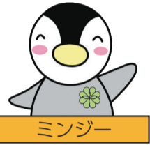
民生・児童委員イメージキャラクター