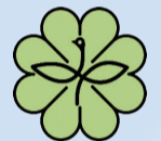
民生委員のマーク