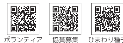
ボランティア募集 協賛募集 ひまわり種子配布希望

※イベントについての詳細は、市報6月15日号に掲載予定です。 【開催期間】7月18日(土)～26日(日)(予定) 【協賛先】産業振興課農政係 ☎042-497-2052