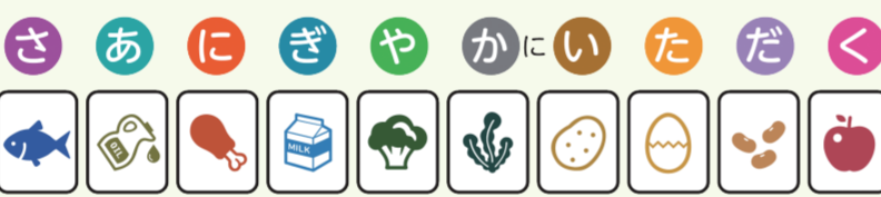
「さあにぎやかにたのぐ」は、東京都健康長寿医療センター研究所が開発した食品摂取多様性スコアを構成する10の食品群の頭文字をとったもので、「ロコモチャレンジ」推進協議会が考案した高栄養です。 ※東京都健康長寿医療センター研究所 健康長寿研究チームより

覚えよう！ 毎日食べたい 10食品群 下の10食品群から1群で1点。 毎日7点以上*が目標です。