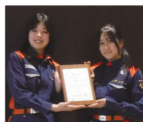
消防庁長官賞を受賞された清瀬消防少年団

この度、清瀬消防少年団が港区にあるニッショーホールで、全国に3,930組織ある少年消防クラブの中から「優良な少年消防クラブ」として、消防庁長官賞を受賞しました。団員の普段からの活動が素晴らしい形で認められたものです。引き続き、清瀬消防少年団の応援とご支援をよろしくお願ひします。 【清瀬消防署】☎042-491-0119