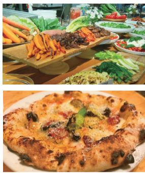
イベントで提供された清瀬産の新鮮な野菜とピザ

清瀬の牧場で搾られた新鮮な生乳が、目黒区碑文谷にある「GOOD CHEESE LABORATORY」へと出荷され、そこで作られているフレッシュチーズとのご縁をきっかけに、今回のイベントが開催されました。会場では、清瀬産野菜の販売や、清瀬産野菜を使用したシェフ自慢のピュッフェ、清瀬産生乳から作られたフレッシュチーズなどが並び、参加いただいた方に清瀬の恵みをご堪能いただきました。