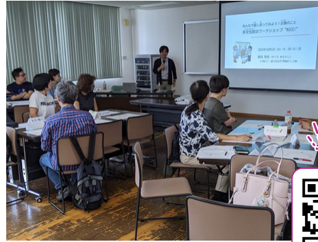
2025年10月開催、防災講座の様子。

中でも中心となるのが、外国人学習者と養成講座を受講したボランティアが1対1で行う日本語教室。身振り手振りや絵なども使いながら日本語で対話を重ね、言葉だけでなく生活や文化も伝え合っています。外国人が日本社会で暮らす上で「言語・制度・心」の3つの壁があるとされていますが、KICはその壁を少しでも取り除こうと、日本語学習支援のほか防災講座や交流イベントなどを開催。中には日本語能力試