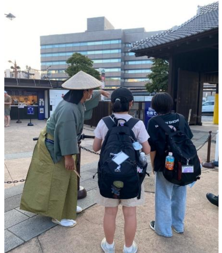
昨年度の派遣中の様子