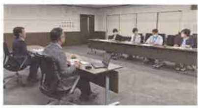
市に申し入れる日本共産党清瀬市議団

共産党は深 刻な物価高 への対策を 求めて、新 年度予算へ の組み替え 案を提案、 予算には反 対しました。