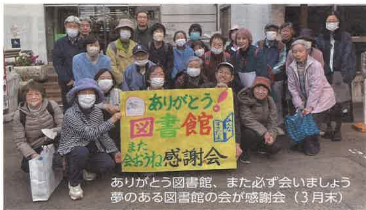
ありがとう図書館、また必ず会いましょう 夢のある図書館の会が感謝会 (3月末)

な旅費の運用なのか、チェックを求めました。地域図書館をなくし、消費生活センターの建物や立科山荘、学校プールの廃止など公共施設の統廃合を進める一方、2億円以上をか