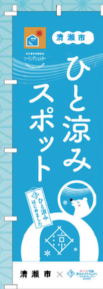
ひと涼みスポットのぼり旗