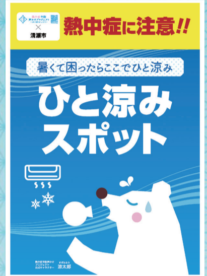
ひと涼みスポットに掲示するポスター