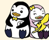
更生ペンギンのホゴちゃんとサラちゃん